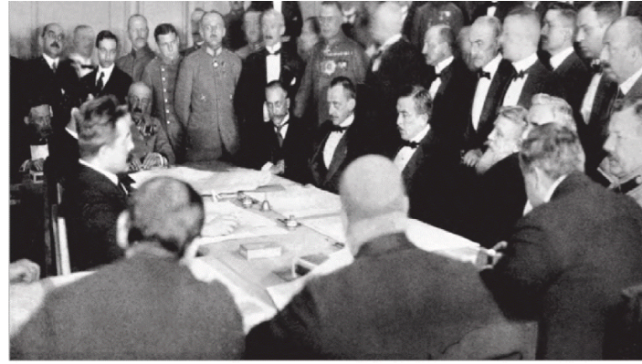
Підписання мирного договору в Бресті

Сеймі достатньо велику фракцію (17 місць з 63), що йменувалася «Український клуб».